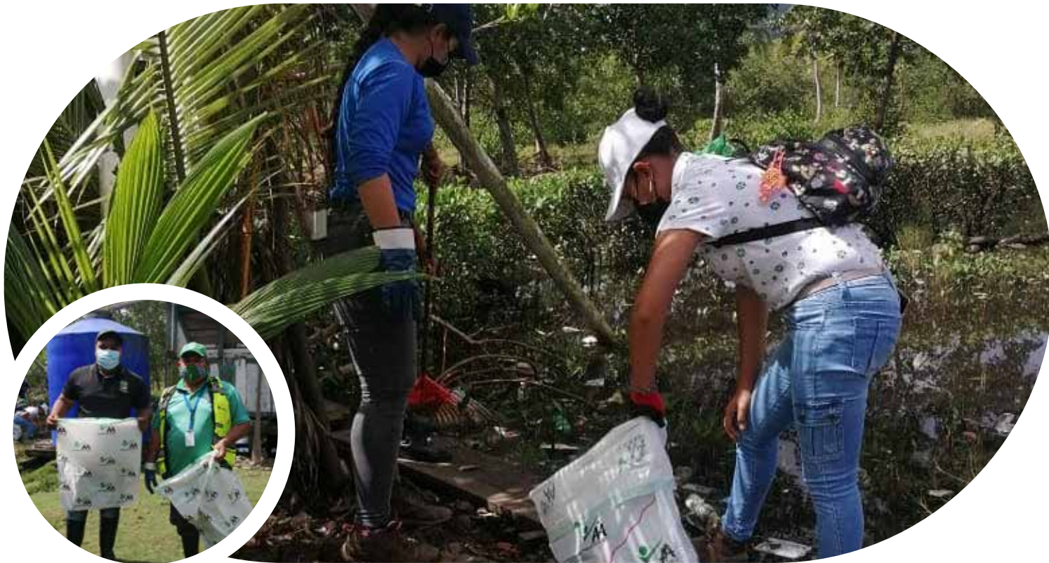
Jornada de limpieza en la Barriada Guaymí 2