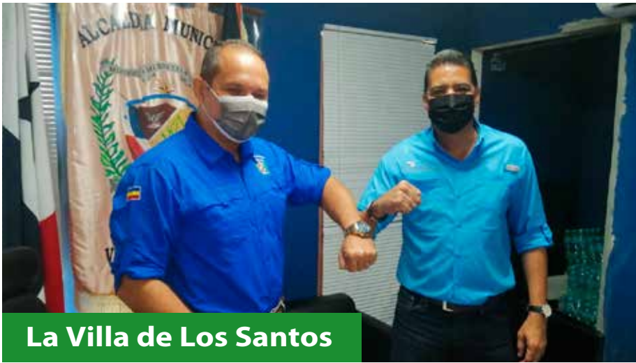
La Villa de Los Santos