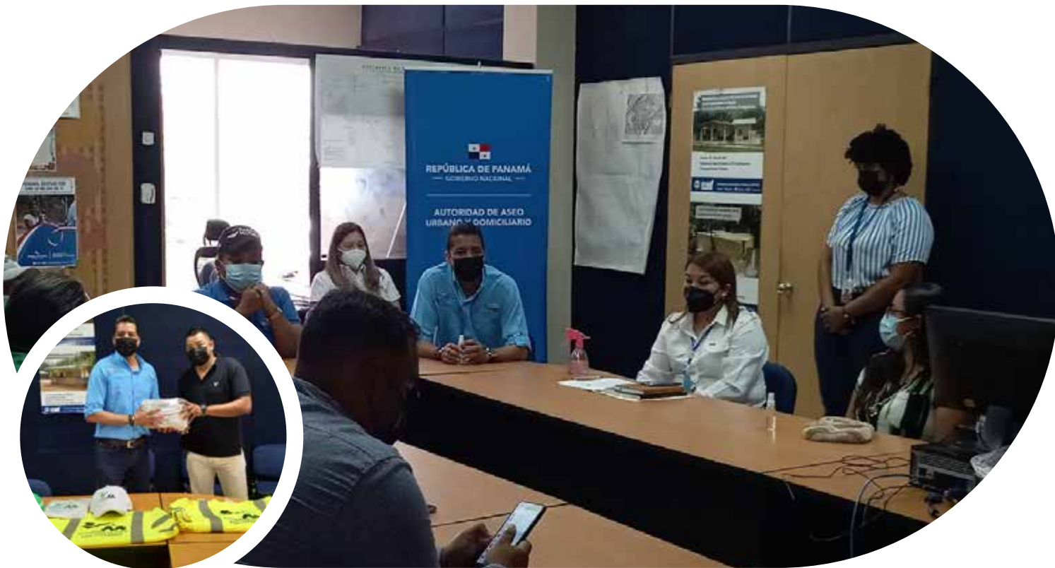
Reunión convocada por la gobernadora de la provincia de Bocas del Toro, en el distrito de Changuinola