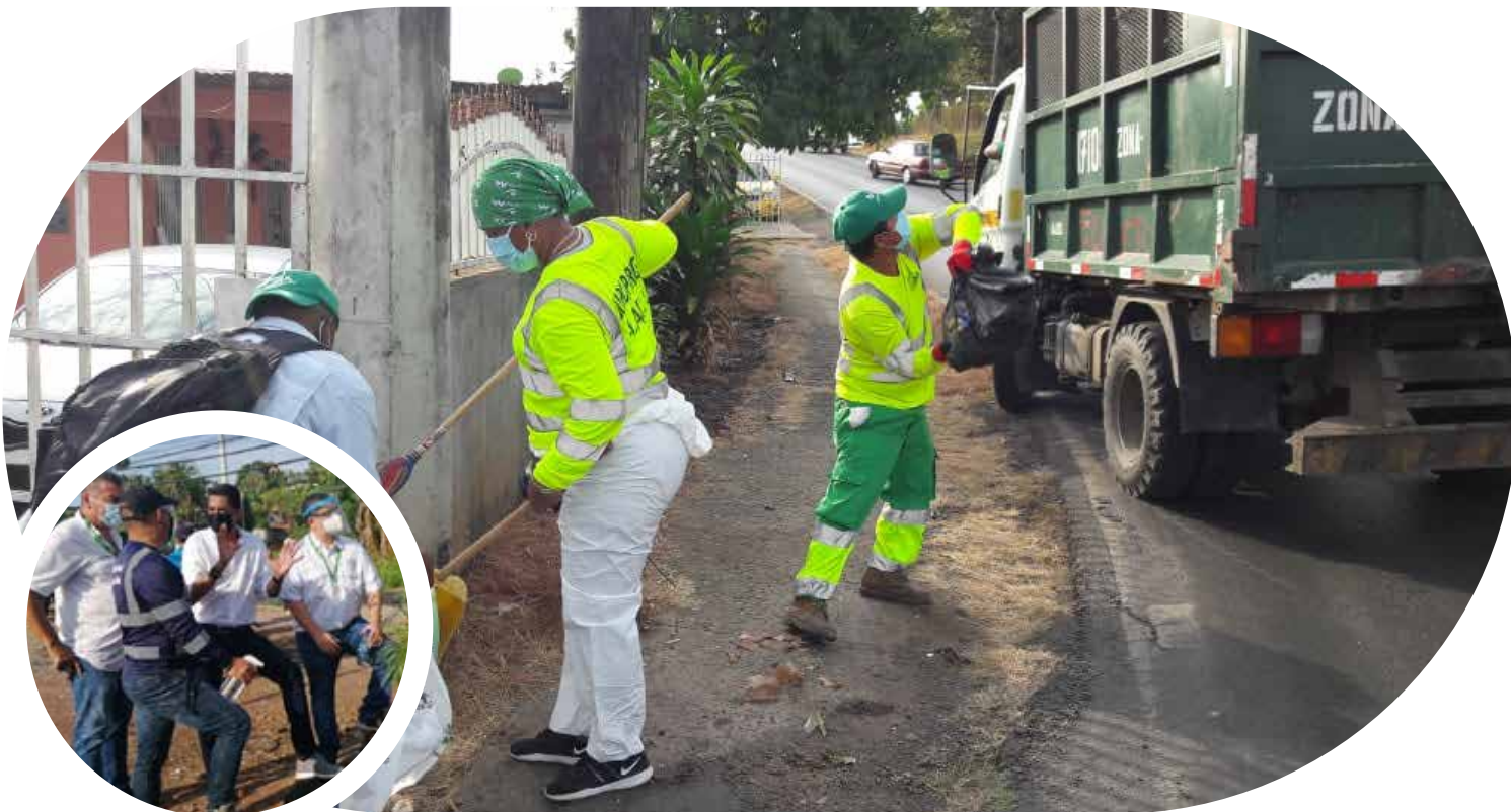
Jornada de limpieza en Las Mañanitas