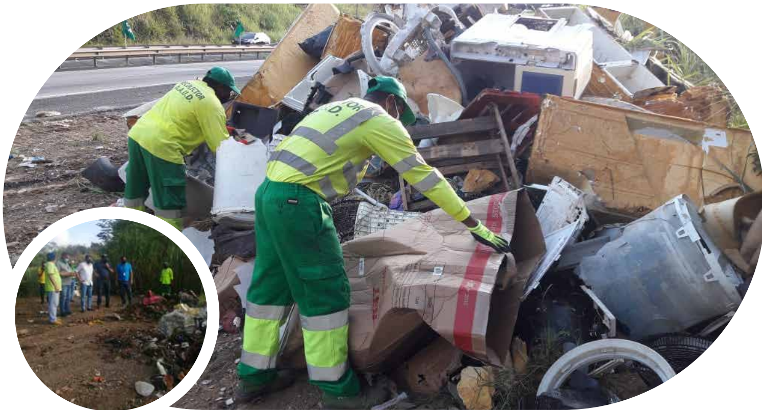
Jornada de Limpieza en la Vía Centenario