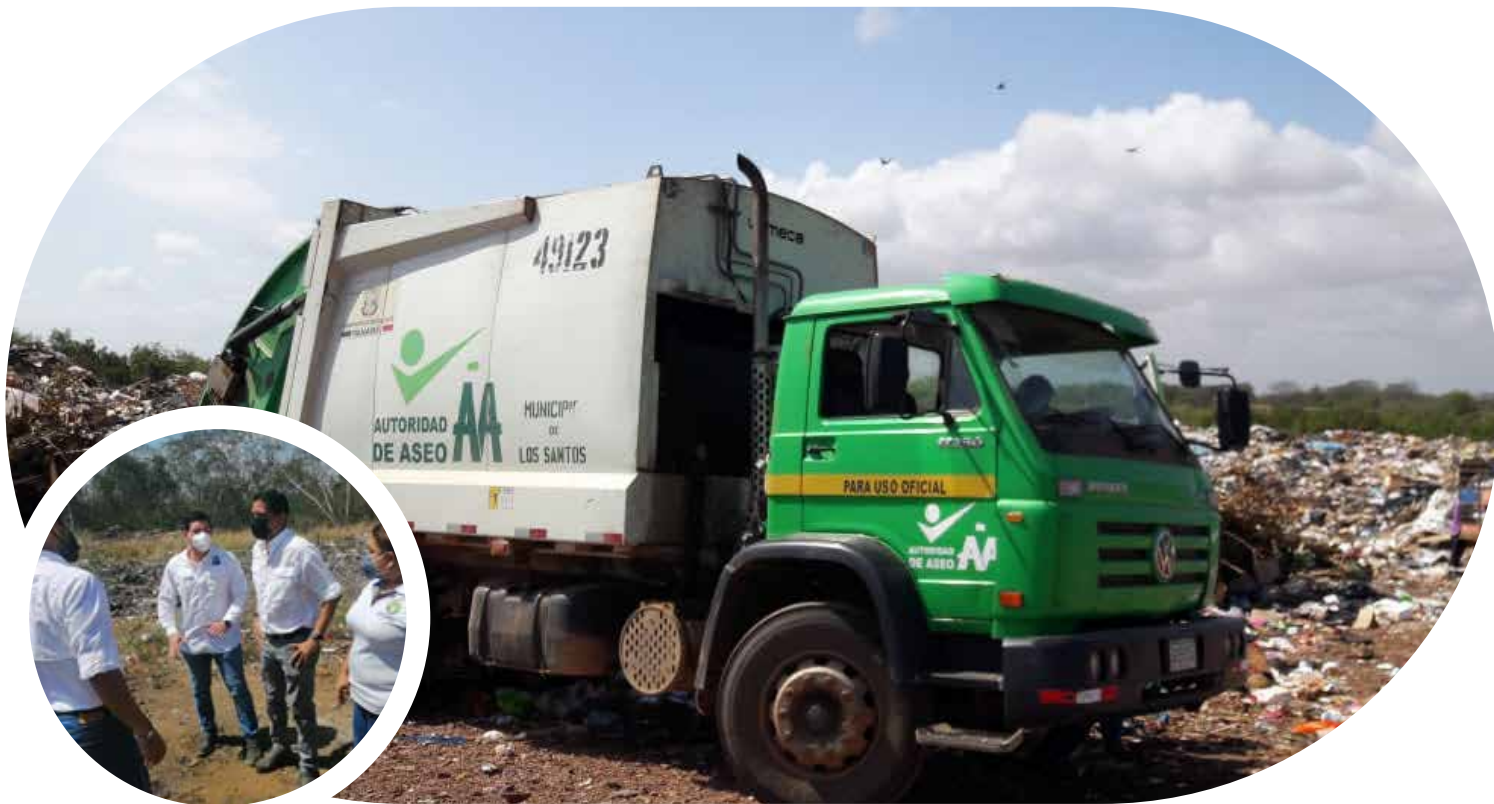
Vertedero de La Villa de Los Santos