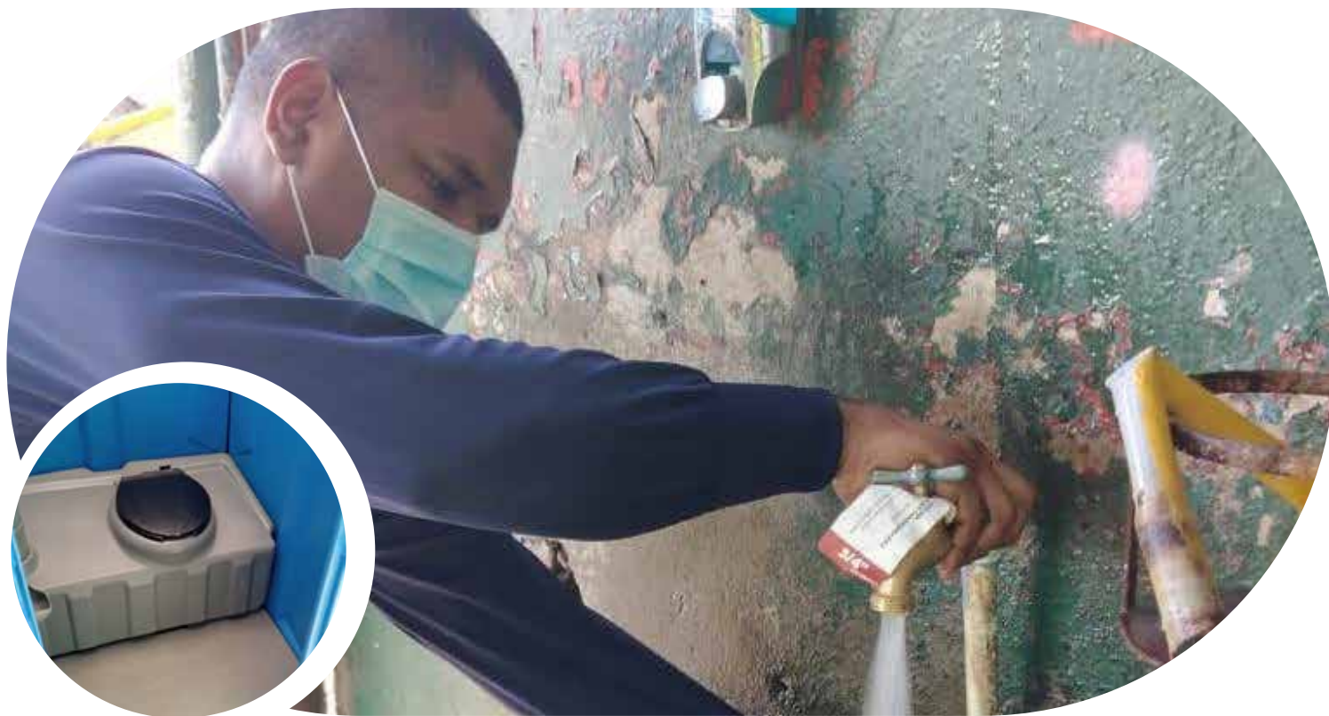
Trabajos en Zona C. Patacón