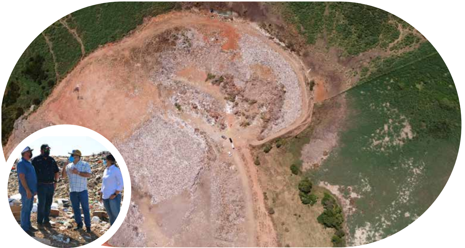
Inspección en el vertedero de Chitré