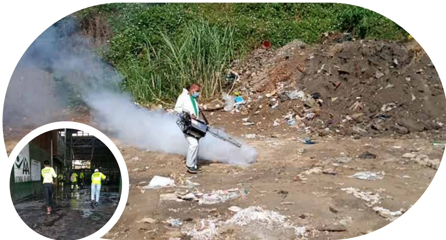
Jornadas de limpieza y desinfección de la Zona A- Pacífico